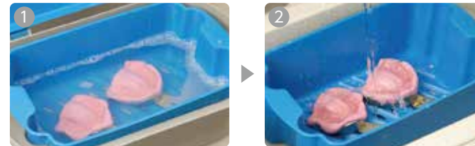
デンタボンによる印象体の除菌 印象体を5～30分浸漬 水洗

洗浄効果もあり、各種印象材に使用できる除菌/洗浄剤。 100倍に希釈して使用するので経済的。