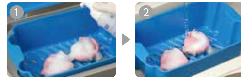
ウルトラ・クレンジムによる印象体の泡洗浄(約3分) 水洗